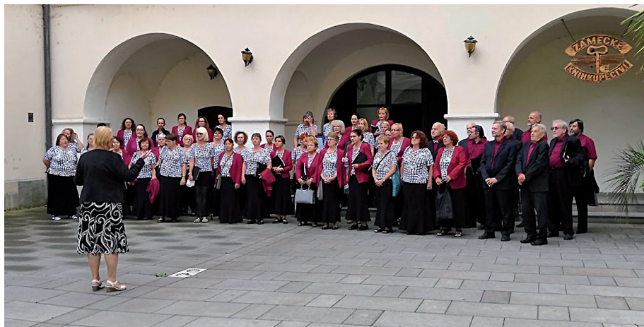
Na nádvoří Choceňského zámku