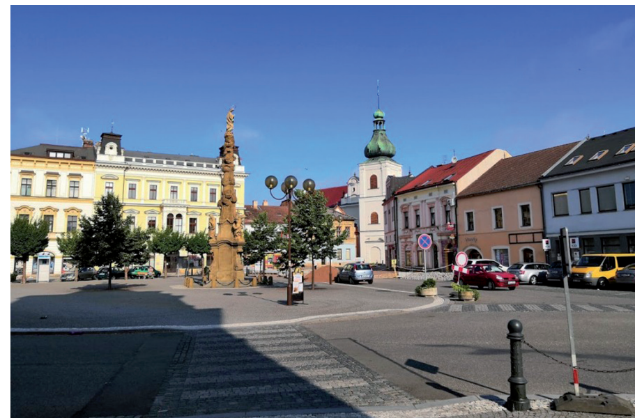
Náměstí v Choceň

Na vrcholu jsme se poctivě podělily o mou tatranku a Mirčinu broskev a bylo nám moc hezky. Cestou zpátky jsme se stavily za ostatními, kteří trávili horký den u vody, a daly si s nimi kafe.