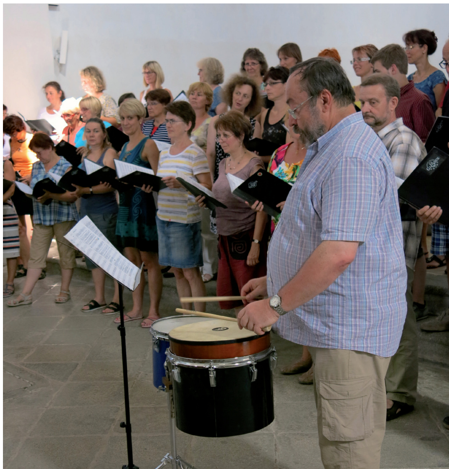
Foto ze zkoušky před koncertem v Milevsku 2015